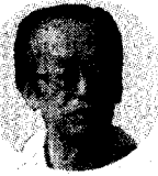
次相 幸相 尾身 前沖

【ホノルル1日外間 聡】第一回世界のウチナ インチュ会議の関連行事として一日午後(日本時間二日前)、前沖縄担当相で沖縄科学技術大学院大学構想を提唱した尾身幸次衆院議員が、会場