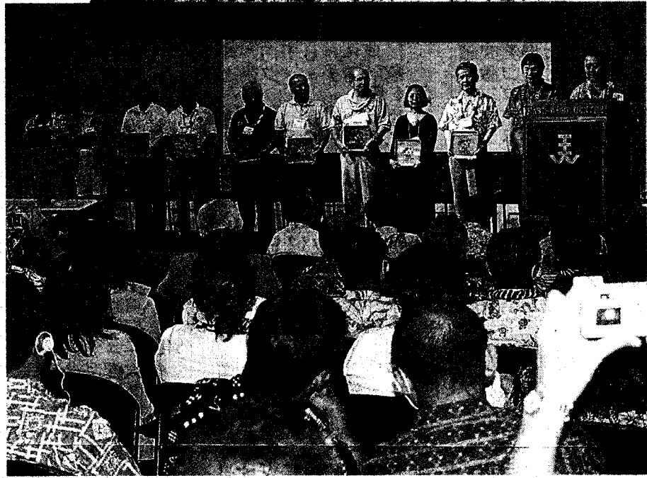
世界9カ国13支部が参加した第7回WUB世界大会。白、ホノルル市の東西センター